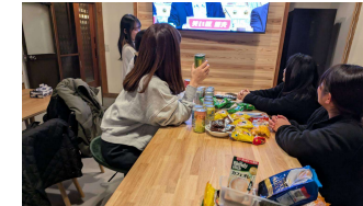
お母さんの寄合 (地域)