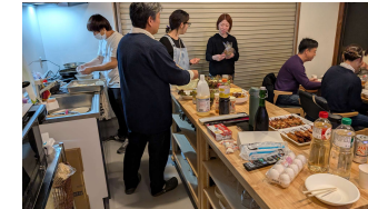
事業所交流会 (他事業所)